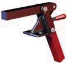
527 Fuß abgewinkelt