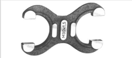
Grenzrachenlehre Nr. 122 A für den Außendurchmesser des Bolzen- gewindes