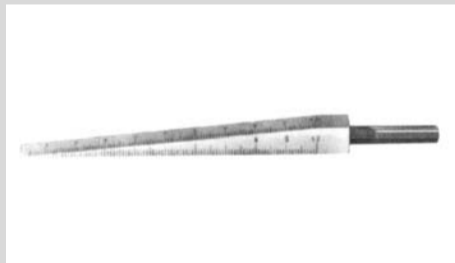
Keillehren (Meßkeile) Stahl, hartverchromt