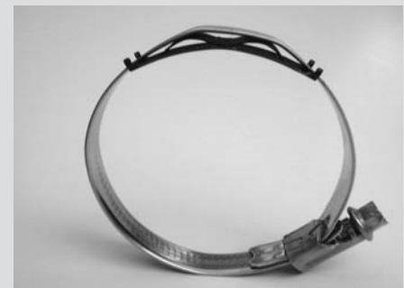
TX-Schellen sind auch mit Wellenfeder, zum Ausgleich des Schlauchsatzverhaltens, lieferbar.