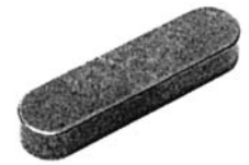
Paßfedern A DIN 6885