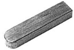
Paßfedern AB DIN 6885