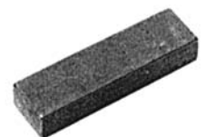
Paßfedern B DIN 6885