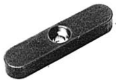
Paßfedern C DIN 6885