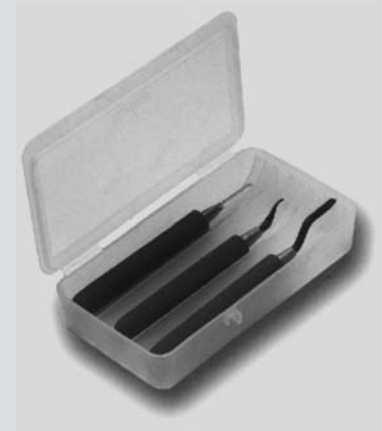
MINI-SATZ "GT-MINI" FT 3000 mit allen drei Mini-Werkzeugen für Feinmechanik und Elektronik