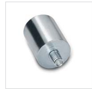
4 Form E mit Gewindezapfen