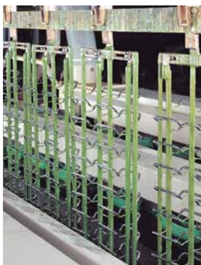
Werkbild: Rohde Rund-Stahlgriffe Typ ST im Galvanoautomat nach dem Vernickeln Picture made by: Rohde Round steel rod handles typ ST after nickel plating in the automatic electroplating plant