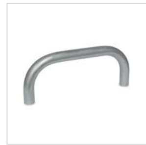
4 Form A einfach gebogen, 90°