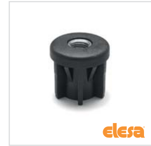
ELESA original design NDX.T