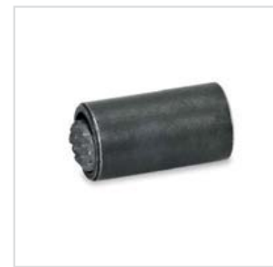
Anwendungsbeispiel verschiedener Pendelelemente mit O-Ring