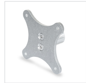
4 Form A mit Verbindungszapfen