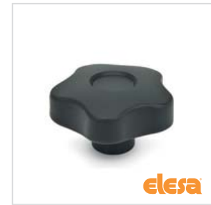
ELESA Original design VCT.