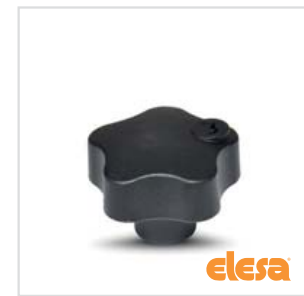
ELESA Original design VLS.