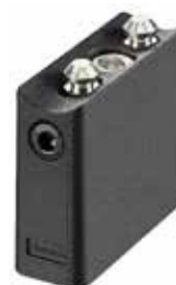
Endkappe End cap