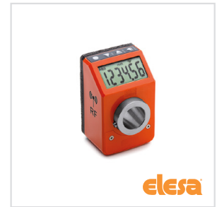
ELESA original design DD52R-E-RF