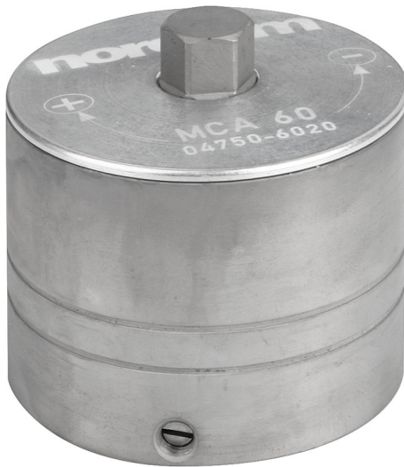
Kraftspannmutter zur Klemmung von Kettenrädern bei der Fräsbearbeitung