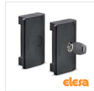
ELESA original design ESC