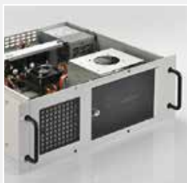
BEG Bürkle GmbH & Co. KG Industry computer