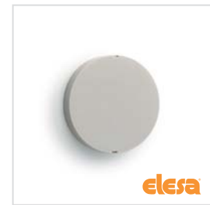
ELESA Original design CP.