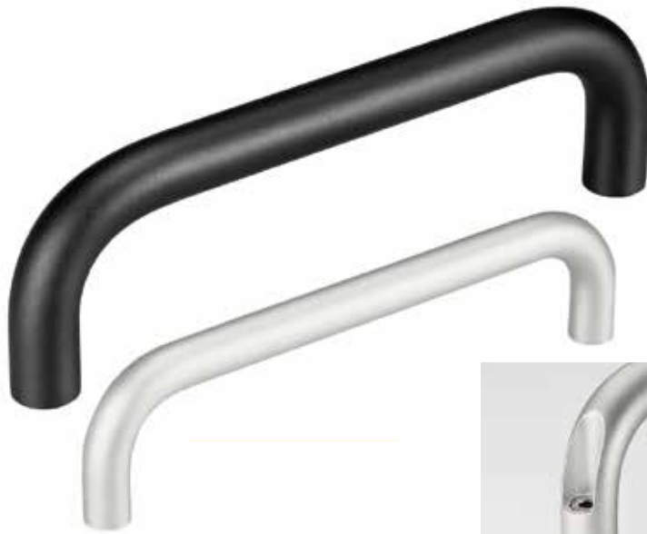
Ausführung M1-20.F (Abschlusscheibe optional) Version M1-20.F (cover plate optional)