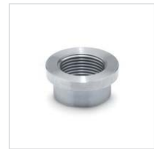
3 Form A mit Fase B mit Bund