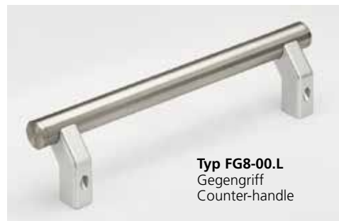
Typ FG8-00.L Gegengriff Counter-handle