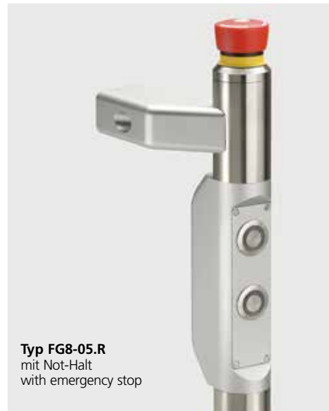
Typ FG8-05.R mit Not-Halt with emergency stop