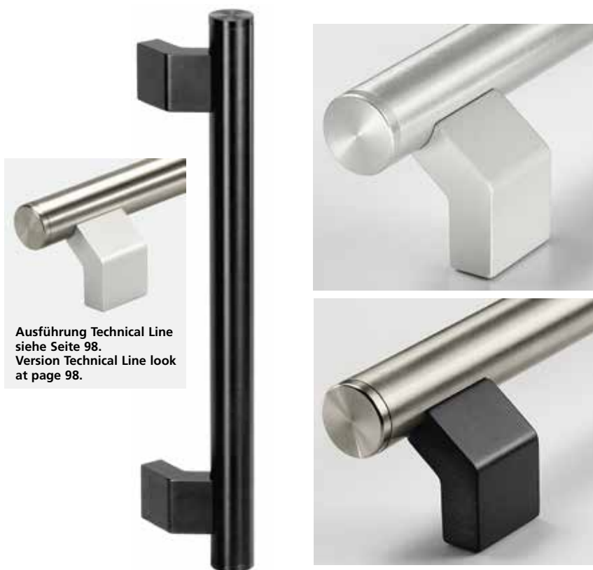
Ausführung Technical Line siehe Seite 98. Version Technical Line look at page 98.