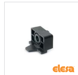
ELESA original design BPS.30-SP