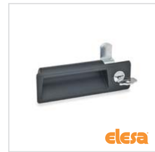
ELESA original design PR-CH / LPR