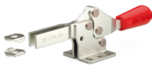
Fuß abgewinkelt Modell 217-U-L ⓘ