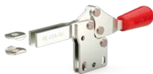
Fuß gerade Modell 217-UB-L ⓘ