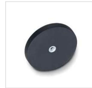
Ansicht auf Haftfläche