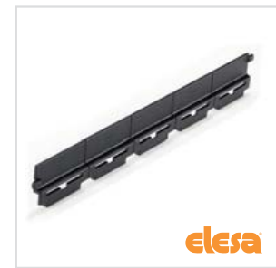
ELESA original design RLT-CE